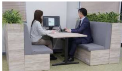
打合せや物を広げて作業したい時に。

様々な目的に合わせてレイアウトを変化させることができます。 アイデアをさっとメモできるよう壁一面にホワイトボードを設置しました。