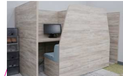
周りからの視線を気にせず、集中したい時に。