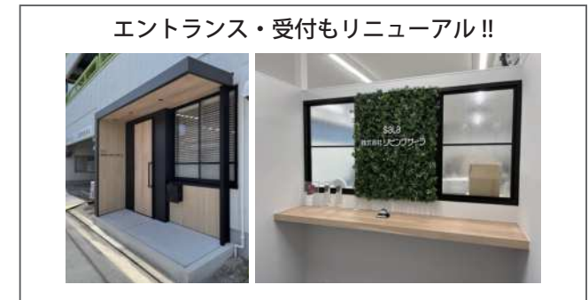
エントランス・受付もリニューアル!!