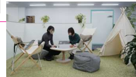
気分転換やランチ、 くつろいだ雰囲気での ミーティングに。