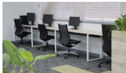
仕切りのない半集中スペース。 種類の異なる椅子を配置し、好みの座り心地を選べます。